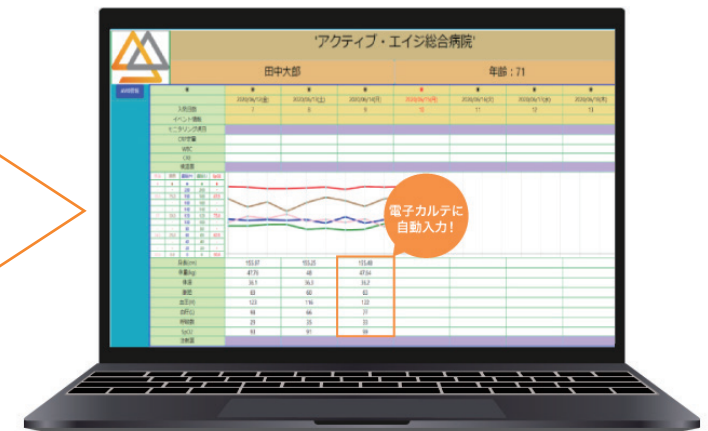
データ収集・管理ソフト